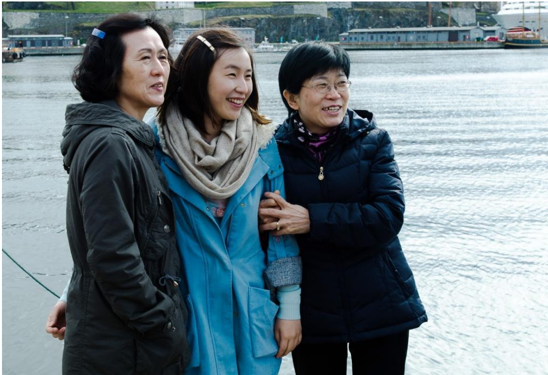
Fra fostermorbesøket i 2012

Alle barna som adopteres fra Korea, bor i fosterhjem helt fra biologisk mor/foreldre frasier seg omsorgen for barnet. For å kunne bli fostermor må man ha erfaring i å oppdra barn, og det kreves at alle familiemedlemmene er delaktige i omsorgen for barnet. Det kreves at fosterforeldrene har god fysisk og psykisk helse, og fostermor må gjennomgå en rekke intervjuer og fullføre et treningskurs.